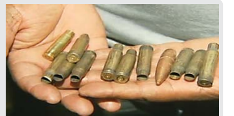
Foto maior: carro-forte alvejado. Acima: cartuchos das balas dos bandidos. Abaixo: carro-forte atingido fica desgobernado e atinge outros veículos